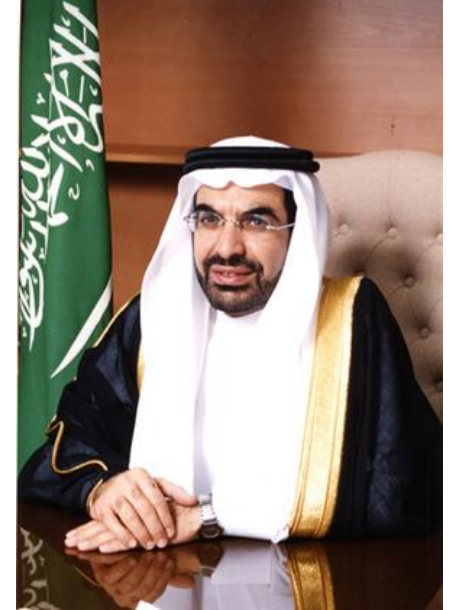
معالي رئيس مدينة الملك عبدالله للطاقة الذرية والمتجددة الدكتور خالد بن صالح السلطان